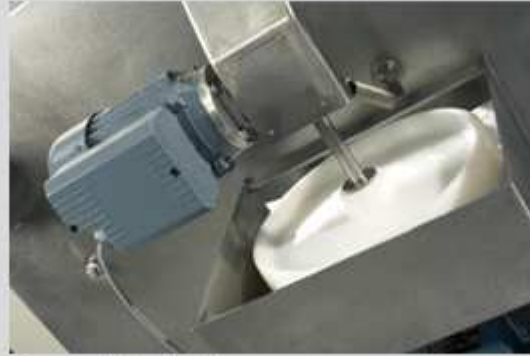
Gearmotortræk på kurv