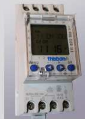
Ugeur for opvarmning og olieskimmer